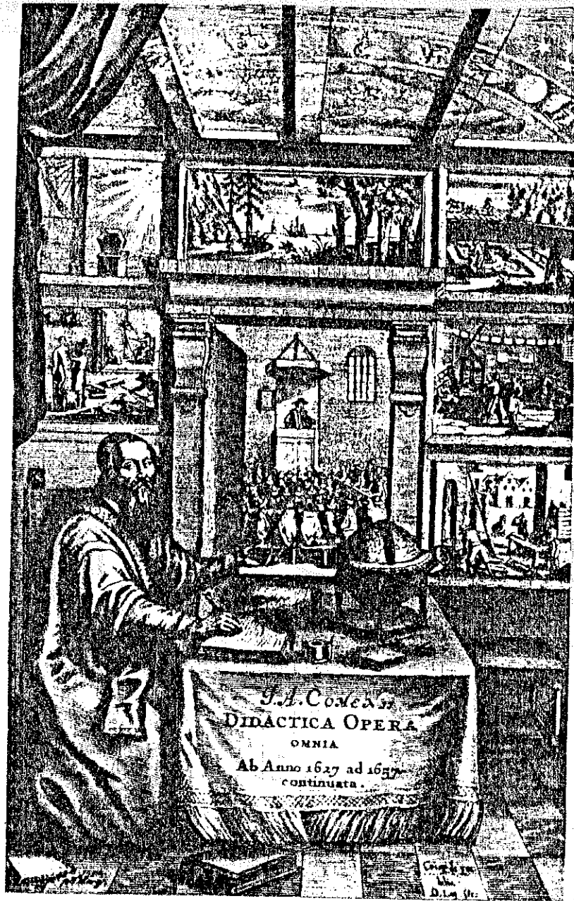
118 - Frontispizio dell'opera omnia di Comenio (1632-1670).